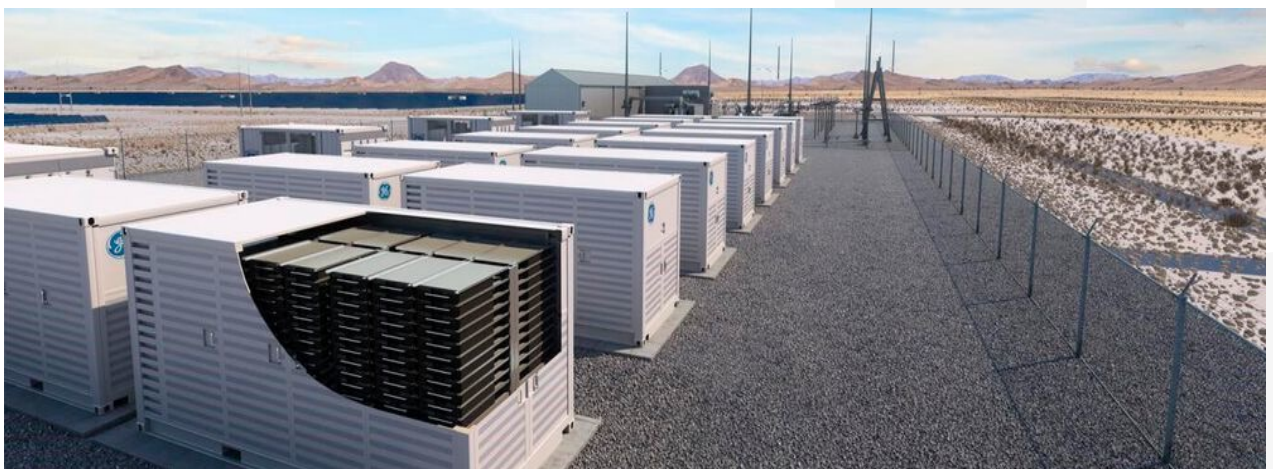
Batteriespeichersysteme (BESS) (eerinstitute.org)